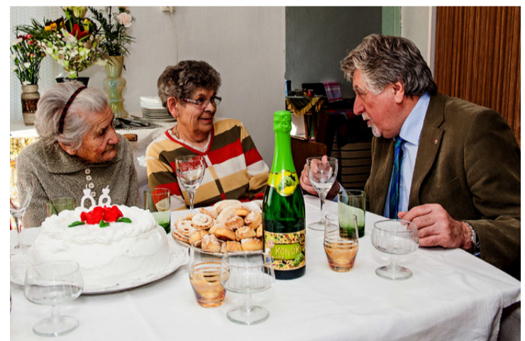
Jó hangulatú beszélgetés lett a köszöntésből

mellette még napszamba is eljárt kapálni. A gyerekek már felnőttek, amikor elhelyezkedett a Videotonban, majd a tsz-ben baromfit gondozott. Az utóbbi munkáját nagyon szerette. A 90-es évek végén vonult nyugdíjba, de otthon