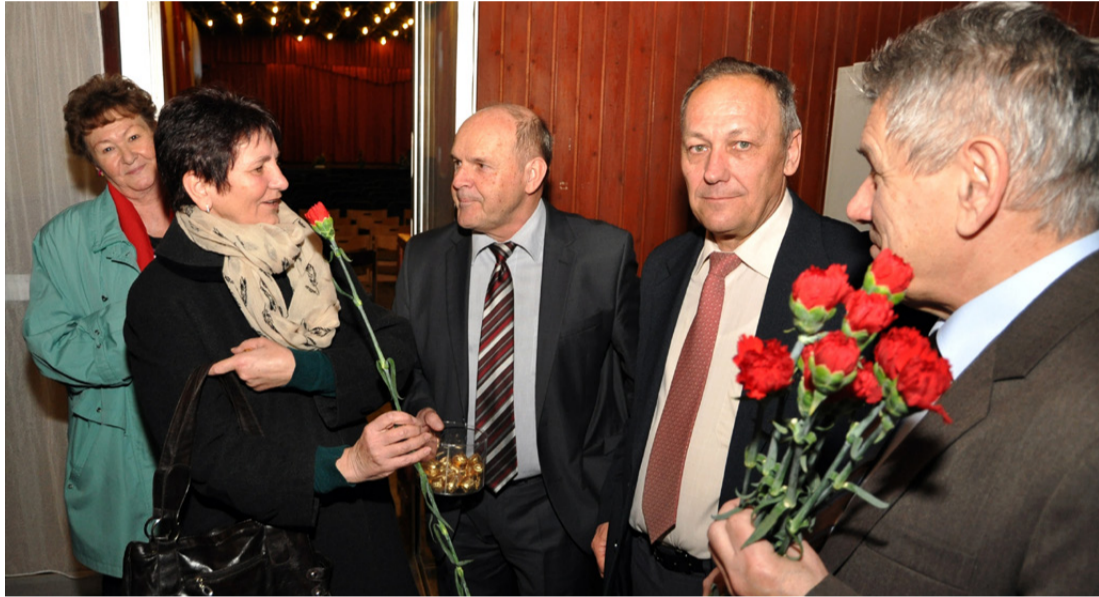
A hölgyeket egy szál szegfűvel és kis édességgel köszöntötték az MSZP helyi vezetői a nőnap ünnepségen

Közel száz éves történelemre tekint vissza a nőnap megünneplése. Sokáig politikai jellegű esemény volt, napjainkra a nőknek kedveskedő, virágot, édességeket ajándékozó és nőket elismerő, méltató programok együttesét jelenti.