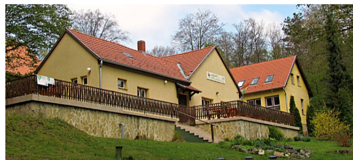
A Hubertus Erdei Iskola épülete

Idén is elindítja nyári egyetemét a Design Terminál Holis, amelyre felsőfokú tanulmányokat végző diákok és frissdiplomások jelentkezését várják május 1-ig.