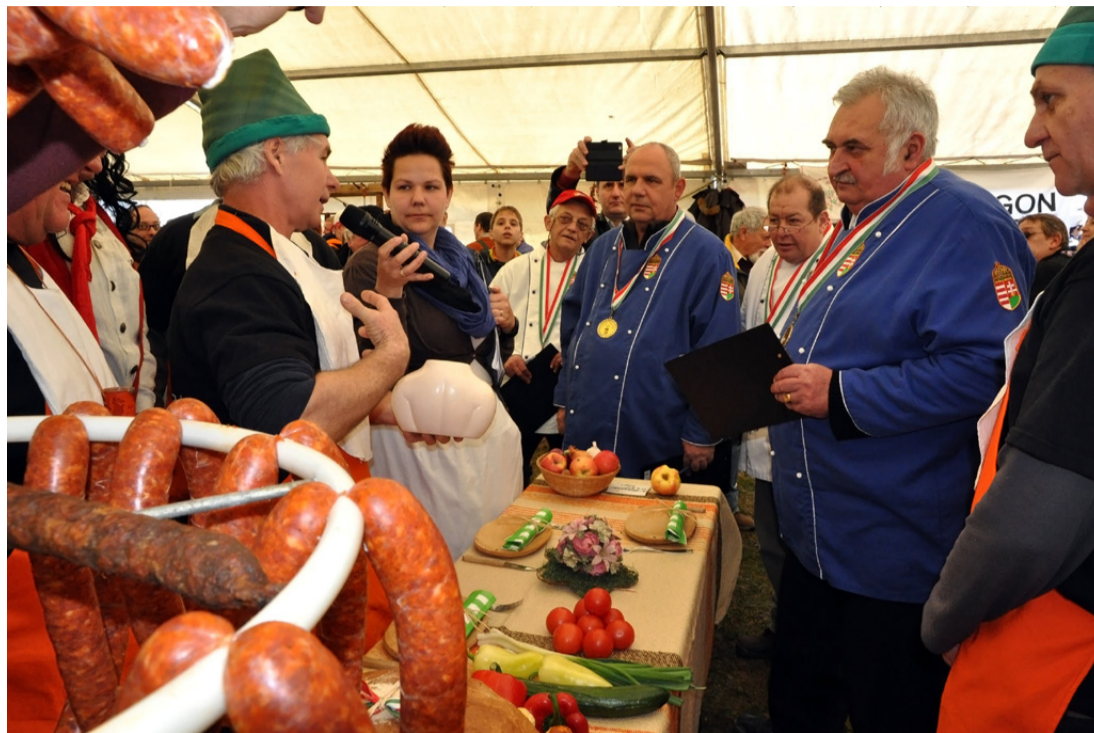
A zsűri – és a konkurencia – mindenre kíváncsi volt

Második alkalommal rendezte meg a Tósokberéndi Egyesület a „TÓBERKÓBI” néven ismertté vált kolbásztöltő versenyét Tósokberénden.