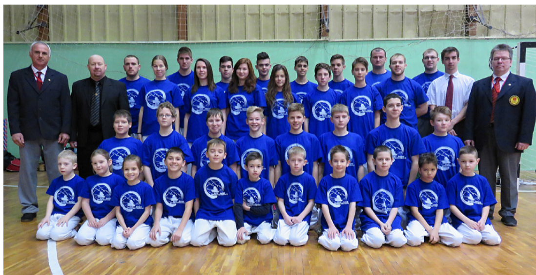
Az éremhalmozó karatés csapat