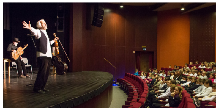
A hétköznapi unalomból felébred a közönség, kinyílnak és csillogni kezdenek a szemek

A foglalkozások tulajdonképpen ismeretterjesztő Muzsikás koncertek a magyar népzeneiről. A zenekar a világ nagy koncerttermeiben tartott műsoraiból mutat be egy-egy órányit a hazai tanuló ifjúságnak, teljesen ingyen, a legnagyobb hazai olajipari vállalat szponzorálásával. A „Rendhagyó énekórát” a tanítási idő egy-egy órájában tartják, kicsöngetéstől, becsöngetésig, alkalmazkodva az iskola rendjéhez.