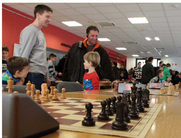
Sok lelkes fiatal versenyző vett részt a sakk diákolimpián