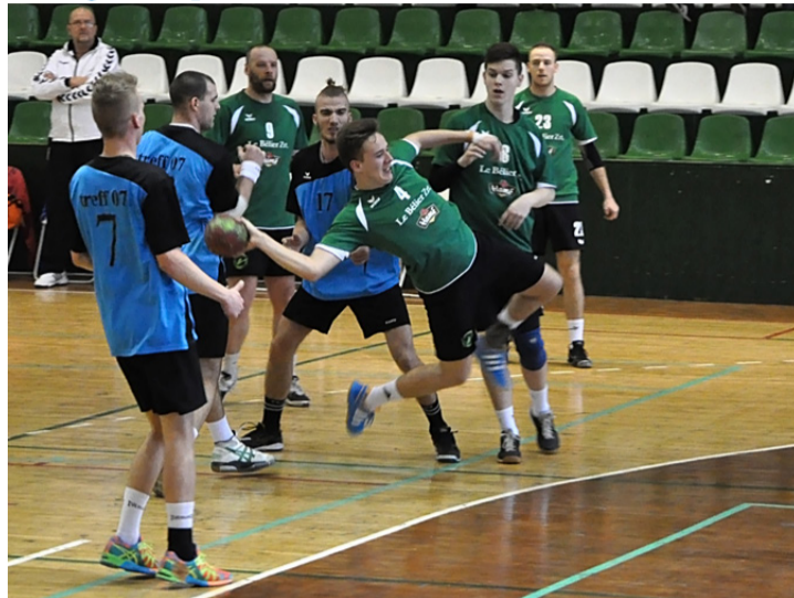
A Le Belier-KK Ajka nagyszerű védekezése eredményes támadójátékkal párosult

Az FC Ajka nem tudott meglepetést okozni Gyirmóton, karatésaink minden ellenfelet maguk mögé utasítottak a Szentgrót Kupán.