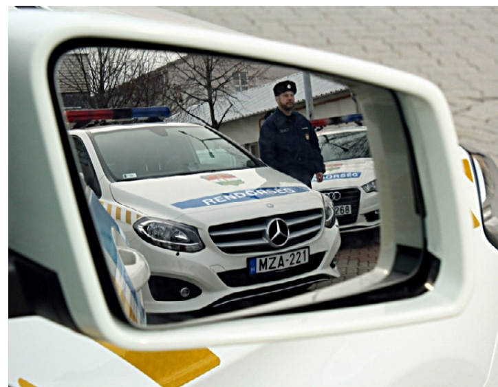
A csúcscatégoriás járművek megnehezítik a szabálysértők és a bűnözők életét

Az átadáson a megye rendőri vezetőin kívül részt vett a Veszprém Megyei Polgárőr Szövetség elnöke, valamint meghívást kaptak azoknak a városoknak a polgármesterei, ahol rendőrkapitányság működik. A rendezvényen a média képviselőinek is alkalmuk nyílt közelebről megtekinteni a rendőri jelleggel ellátott és jelzés nélküli Audi, Mercedes, Seat, Skoda és Suzuki típusú járműveket.