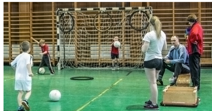
Gazdag a kínálat, de azért a foci a legnépszerűbb

Egészséges életmódra nevelés, képességfejlesztés, tehetséggondozás, ezeket a lehetőségeket kínálja a Fekete – Vörösmarty iskola testnevelés tagozatos osztálya.